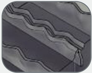
Vzájemně se blokující dvojitě zvlněné lamely zajišťují tuhost dezénu