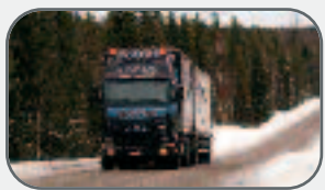
Sněh / bláto