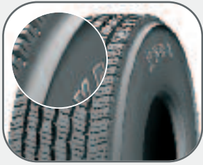
Antisplash 4 násobně snižuje úroveň rozstříkávání vody