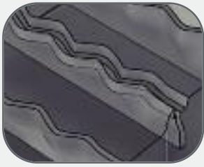
Vzájemně se blokující dvojitě zvlněné lamely zajišťují tuhost dezénu